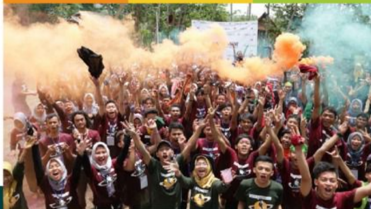
KEGIATAN LKMM-TD MANAJEMEN UPY