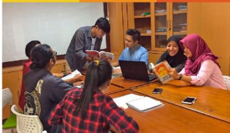
FOCUS GROUP DISCUSSION