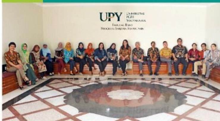
DOSEN PROSA MANAJEMEN UPY